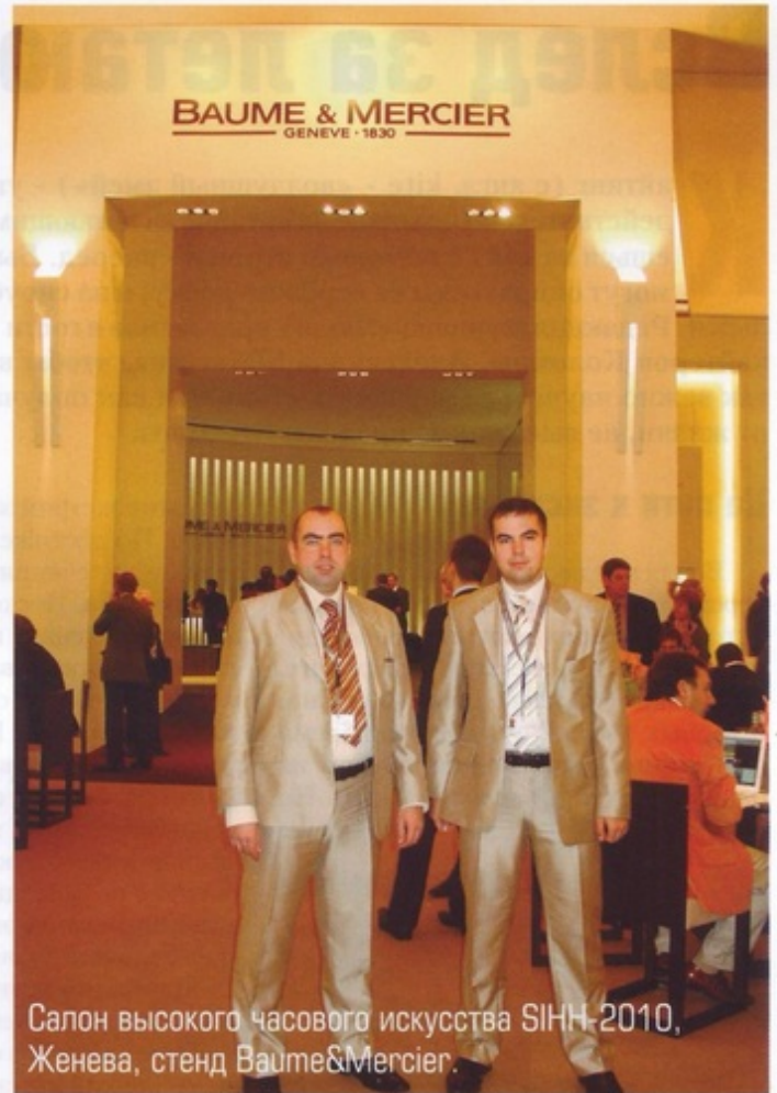
Салон высокого часового искусства SIHH-2010, Женева, стенд Baume&Mercier.

Baume & Mercier позиционирует себя как современный бренд, следящий за всеми тенденциями технологий и дизайна. Идя в ногу со временем, он представляет модели, в которых все больше появляется необычное сочетание материалов, он постоянно следит за модой, а порой и сам создает модные тенденции, сочетая, например, каучук с бриллиантами. Среди представленных новинок элегантно и по-спортивно смотрятся модели серии Classima Executives с функцией хронографа с черным циферблатом в стальном корпусе на черном каучуковом ремне. Кроме того, интерес вызывают представленные многофункциональные модели все той же Classima Executives, подчеркивающие свой неиз-